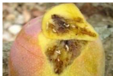
Des vers sortent des oeufs des mouches des fruits

Les mouches des fruits sont de mauvaises mouches qui causent beaucoup de dégâts dans les vergers de mangue, d'orange, d'avocat, de goyave et bien d'autres fruits. Les mouches des fruits peuvent détruire une récolte entière, et même empêcher les exportations.