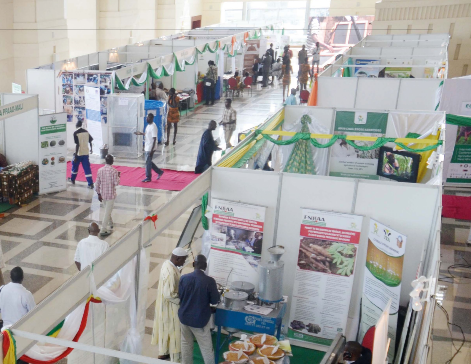
Vue des stands ECOWAP + 10

le programme PPAAO/WAAPP Sénégal a permis la diffusion de plusieurs paquets technologiques, avec une prise en compte réelle de l'aspect chaîne de valeur, comme le développement du Système de Riziculture Intensive (SRI), les techniques de gestion durable des terres, le placement profond de l'urée dans le bassin du fleuve Sénégal, la lutte contre la mouche de la mangue, la promotion de la