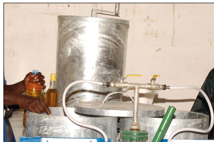
TABLE DE TRAITEMENT DE L'HUILE " SEGGAL "

L'huile obtenue est ainsi clarifiée et débarrassée de l'aflatoxine à plus de 90%.