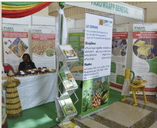
Vue du stand du PPAO/WAAPP Sénégal