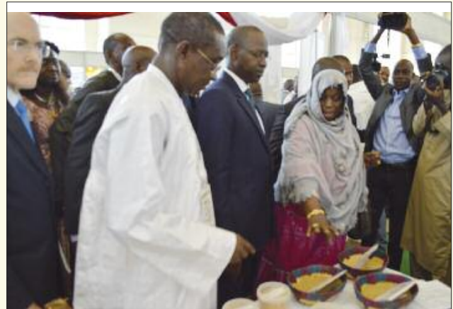
Visite du Premier ministre Mahammad Boun Abdallah Dionne au stand du PPAO/WAAPP Sénégal