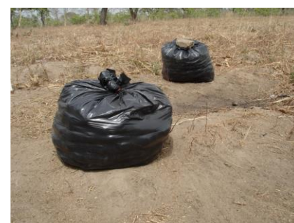
Fruits ramassés enfermés dans des sacs noirs mis au soleil

Auteurs : Antonio Sinzogan, Aboubacar Kadri, Sidiki Traoré