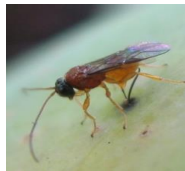
Un insecte utile attaque les œufs de mouches dans la mangue

Au bout des 30 jours 4 cages seront remplies. Videz la première cage et remplissez-la à nouveau. Faites-le chaque semaine avec une autre cage jusqu'à la fin de la récolte.