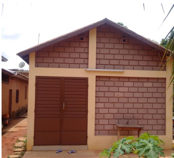
Figure 2: Laboratoire rénové dans le cadre du projet (Univ. Abomey Calavi-Benin)

L'espace du laboratoire de production de masse des parasitoïdes du SPV Bénin a été aménagé et équipé d'étagères. Le laboratoire dispose ainsi d'espace suffisant pour la production de masse des parasitoïdes et à accrue sa capacité de 10 000 parasitoïdes par an et pourra disposer de quantité suffisante de parasitoïdes pour les essais de lâchés inondatives en 2016. (figure 2&3 du labo)