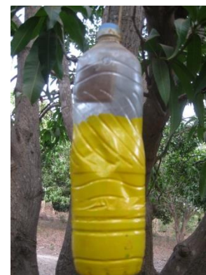
Piège à mouches faite avec une bouteille vide

Remplacez les produits dans les pièges une fois par mois jusqu'à la fin de la récolte.