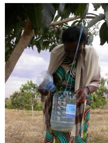
Piège avec levure et insecticide attire et tue les mouches

Chaque semaine, traitez une autre branche. Ne traitez pas lorsqu'il y a du vent. Comme les pluies lavent l'appât des feuilles, reprenez le traitement après une pluie forte.