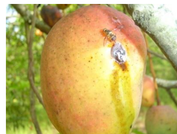
Mouche des fruits qui pond dans une mangue

Les mouches des fruits font beaucoup de dégâts dans les vergers de mangues, d'oranges, de goyaves et bien d'autres fruits. Les petits vers blancs sont leurs enfants qui se trouvent dans les fruits tombés où les insecticides ne peuvent pas les tuer. Donc traiter votre verger avec des insecticides est une perte d'argent. Les vers vont grandir et devenir des mouches et ils vont attaquer vos fruits sains.