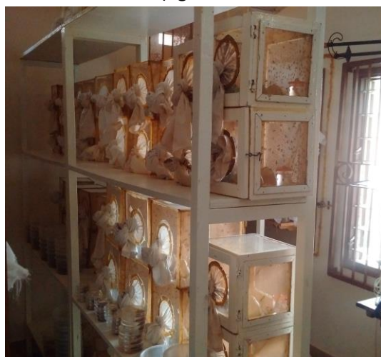
Figure 3 :Une vue de l'intérieur du laboratoire rénové (Univ. Abomey Calavi-Benin)