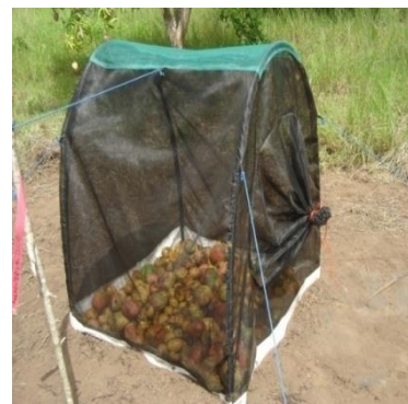
Mangues tombées mises dans une cage en filet fin

Auteurs: Bokonon-Ganta H. : Aimé, Dieng Elhadji O. & Rosine B. Wargui