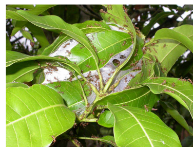
Protégez les fourmis tisserandes et leurs nids