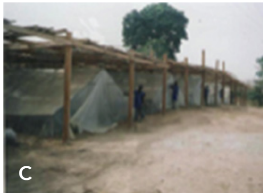
Figure 2 : Tunnel de production. (A) armature en bois du tunnel, (B) film plastique transparent en polyéthylène couvrant le tunnel, (C) tunnels disposés sous ombrière.