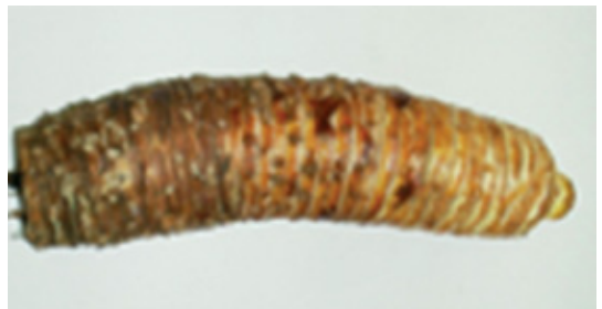
Figure 3 : Tige décortiquée d'ananas

La multiplication des rejets d'ananas sur tiges décortiquées est basée sur des plantes âgées ou pieds mères provenant d'une plantation déjà récoltée. Les plantes arrachées sont débarrassées de leurs feuilles, racines, base terminale et pédoncule. La tige obtenue est lavée à l'eau de robinet et sectionnée longitudinalement en deux (Figure 3).