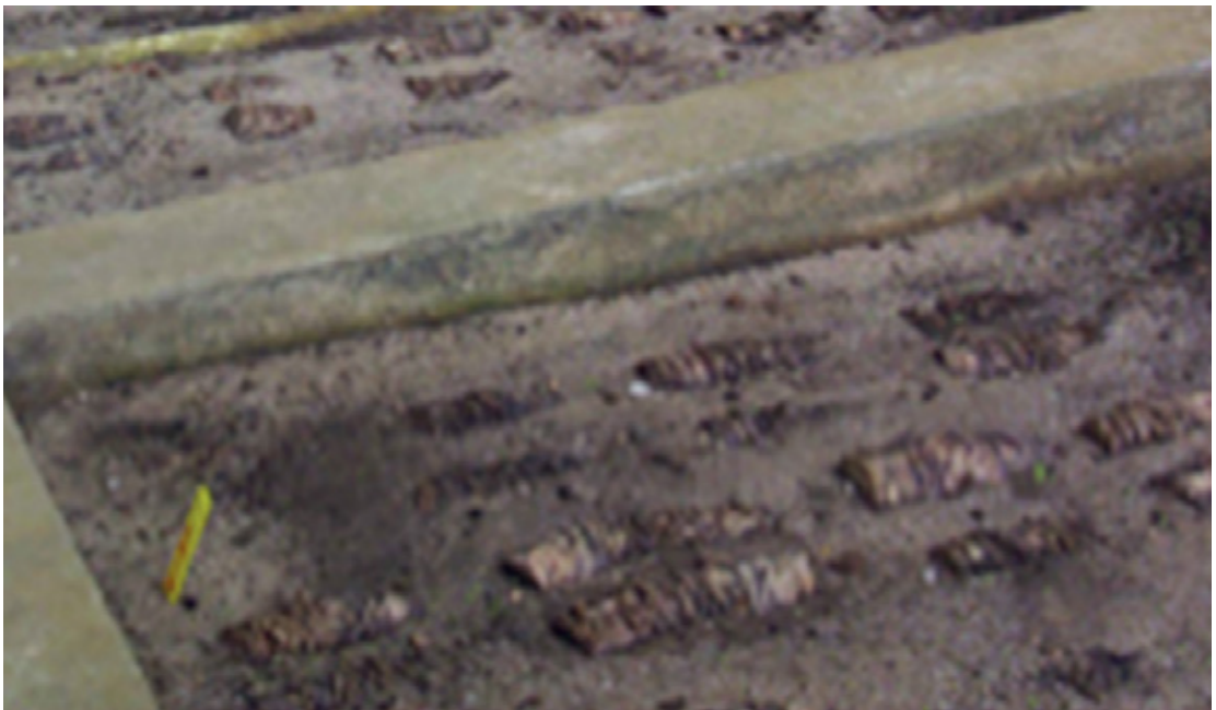
Figure 4 : Mise en place des tiges d'ananas sectionnées longitudinalement sur le substrat dans le tunnel de production

Cinq différents substrats ont été testés : (1) terreau + tourbe, (2) terreau + fibre de coco grossier, (3) terreau + fibre de coco rendu en poudre, (4) fibre de coco grossier + fibre de coco rendu en poudre et (5) tourbe + fibre de coco grossier + fibre de coco rendu en poudre. Les différents composants des substrats ont été mélangés en portion égale. Chaque partie sectionnée des tiges est légèrement enfoncée dans le substrat. Les tiges sont arrosées régulièrement en évitant la saturation d'eau (Figure 4).