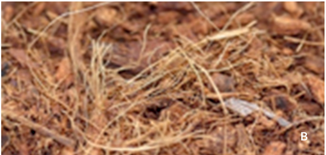
Figure 1 : Partiellement rendu en poudre (A) et Fibre de coco grossier (B)