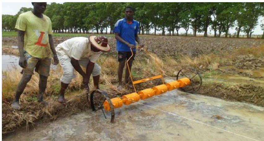
Figure 1 : Copie du « Semoir Philippin » reproduite par l'Atelier d'Assemblage de Matériels Agricole (AAMA)

Copy of the « Filipino Seeder » reproduced by the Assembly Workshop of Agricultural Equipment